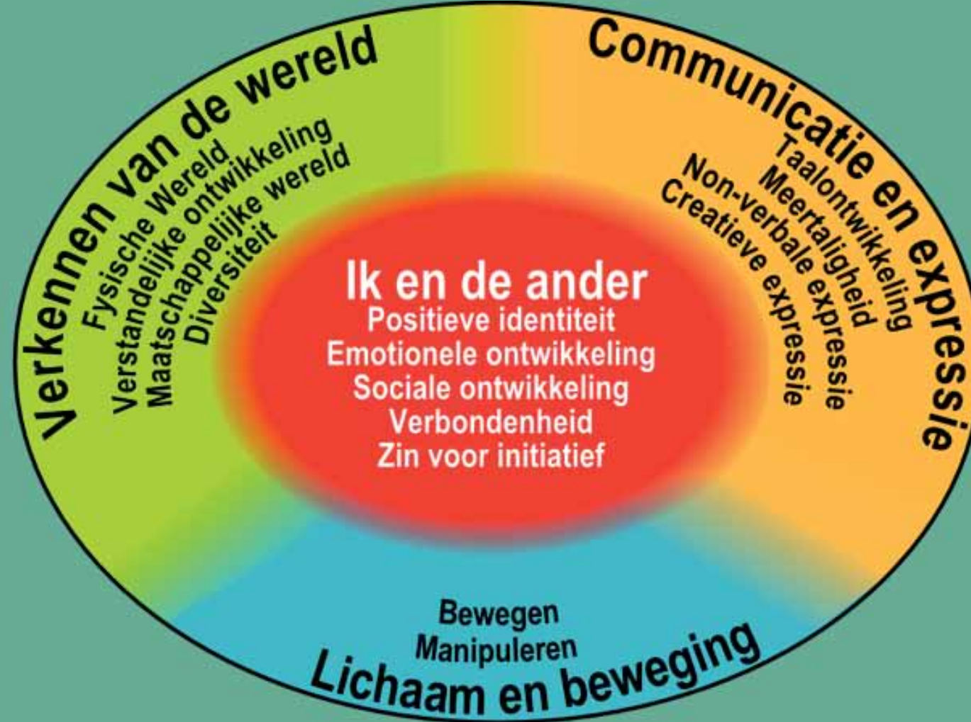
Figuur 1: De vier ervaringsgebieden met sleutelervaringen

Met de ervaringsgebieden zet het raamwerk bakens uit voor een waarderende en uitdagende leefomgeving, met respect voor het individuele ritme, talenten, de eigenheid en het initiatief van elk kind. Elke benutting van de ervaringsgebieden blijft onderworpen aan de kernvoorwaarden van kwaliteit: kinderen voelen zich goed en zijn geboeid bezig.